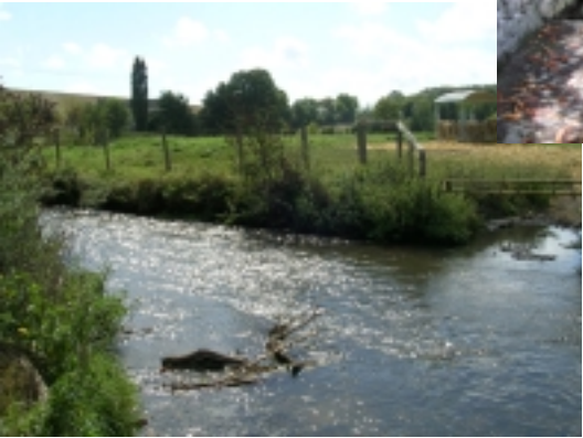
La Mauldre à l'aqueduc de l'Avre