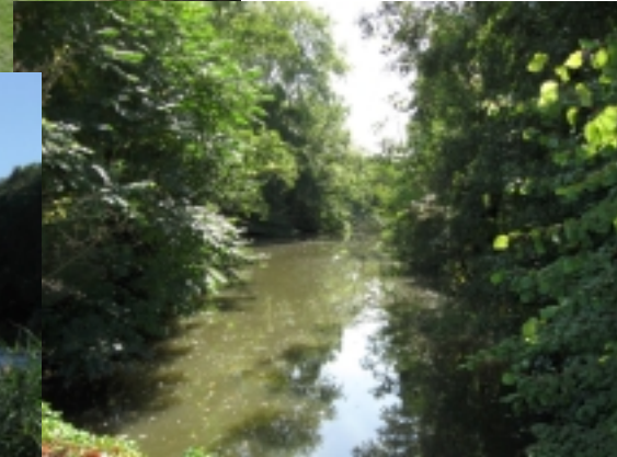
Étang du pavillon de chasse