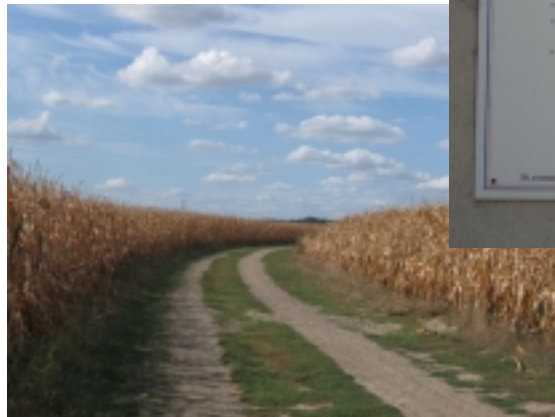
En rejoignant Cressay