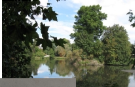
L'étang des Fauvettes