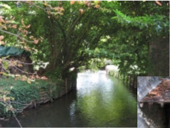
La Mauldre au lavoir de Cressay