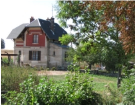
Pavillon de chasse à Pontchartrain