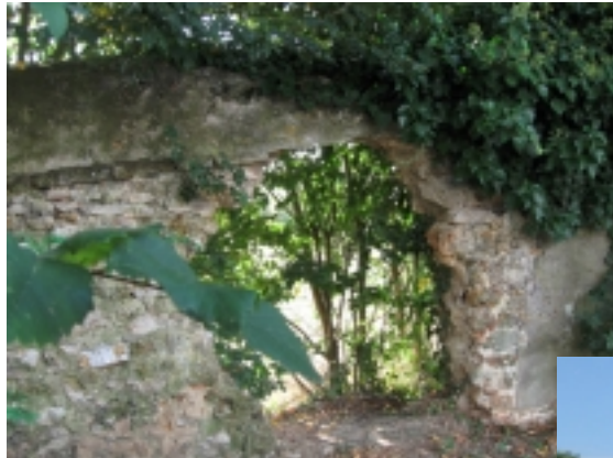
Bèche dans le mur du parc