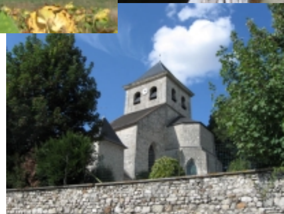
Église de Neauphle-le-Vieux