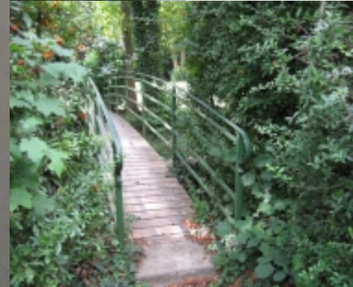
Pont sur la Guyonne