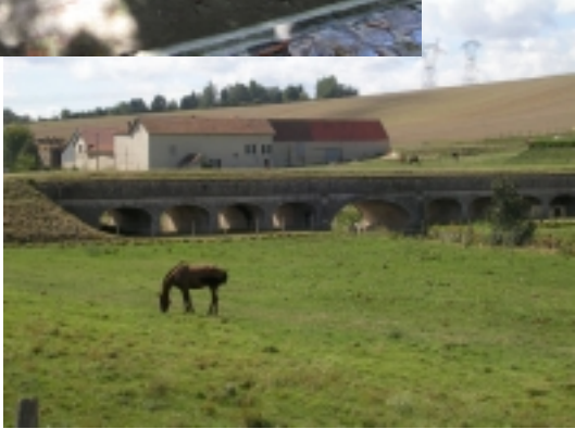
Aqueduc de l'Avre