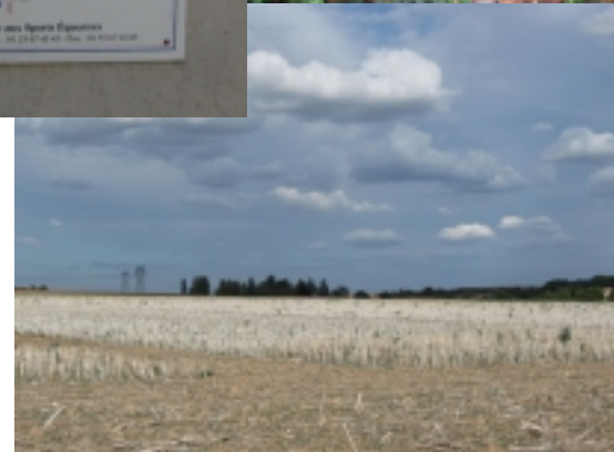
Des champs à perte de vue