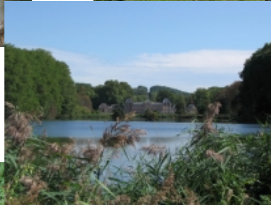
L'arrière du château