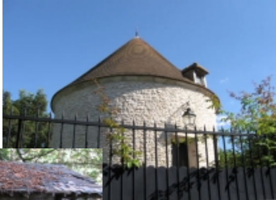
Colombier des Rois Maudits