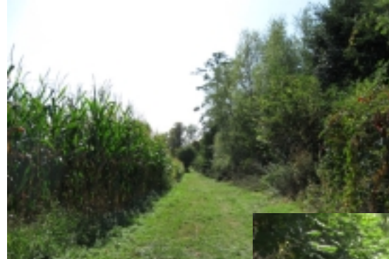
Allée pour rejoindre le château